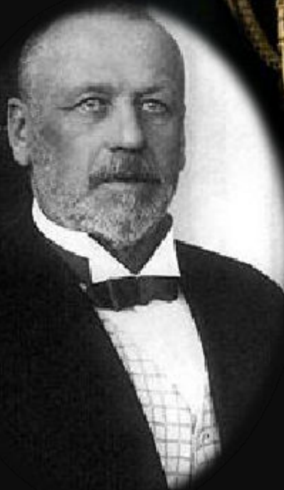
М. В. Родзянко