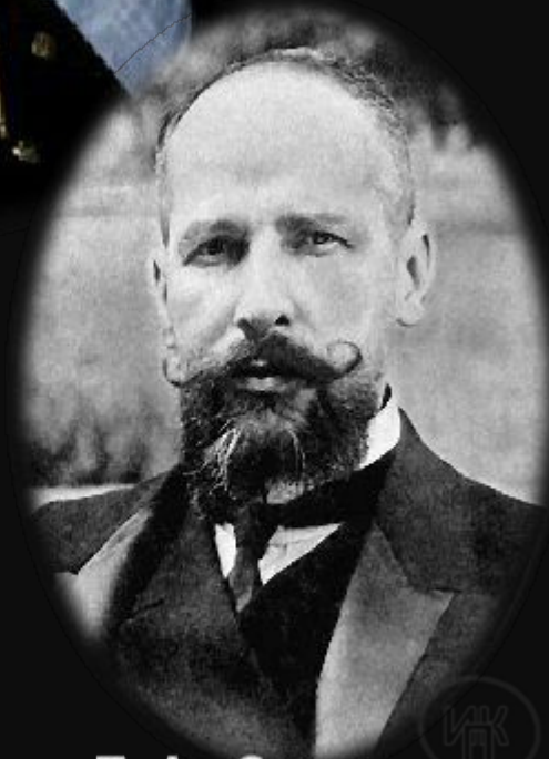
П. А. Столыпин