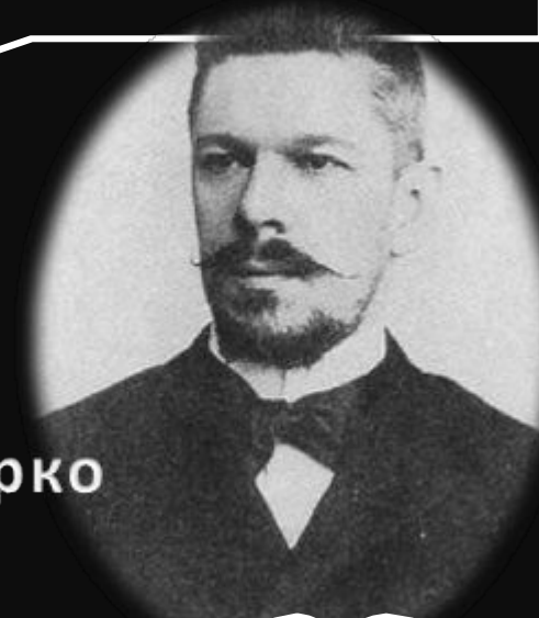
В. И. Гурко

План Гурко предусматривал, что каждый член общины имел право выхода из нее и закрепления за собой собственных земельных участков. Он мог сделать с ними, что хотел: продать, купить, заложить.